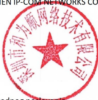
Zhou Jun Menadžer prodaje međunarodnog poslovanja